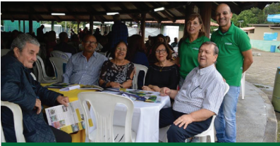
Homenagem aos pais na Aposvale