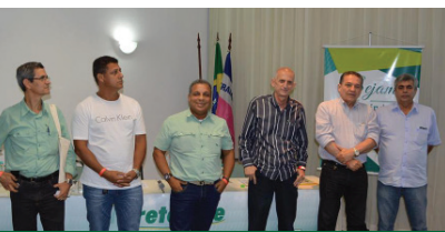
Conselho Administração eleito na AGO