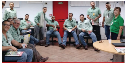
Cretovale no turno Usinas I a IV