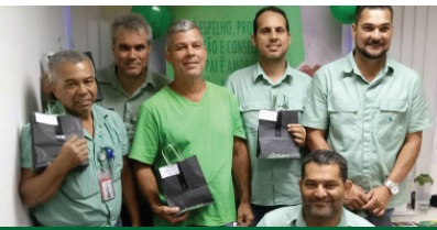
Dia dos Pais nas Agências