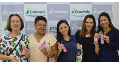
Dia Internacional da Mulher nas Agências