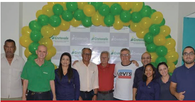
57 anos Cretovale