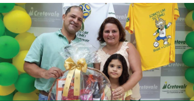
Ganhador da cesta de Dia dos Namorados