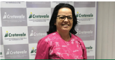
Cretovale apoia Outubro Rosa