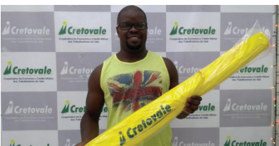
Lançamento da Campanha Indique um Cooperado