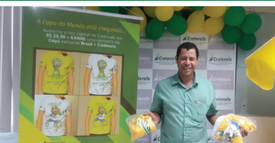
Lançamento Campanha Capitalização Copa