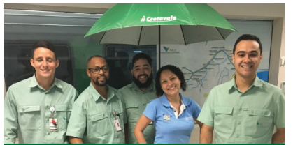
Cretovale em Porto Velho