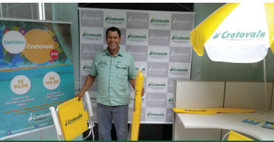
Lançamento da Campanha Capitalização