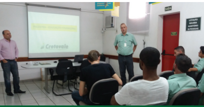
Educação Financeira na Estação Piraqueçu