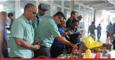
Páscoa e Clube de Vantagens Cretovale