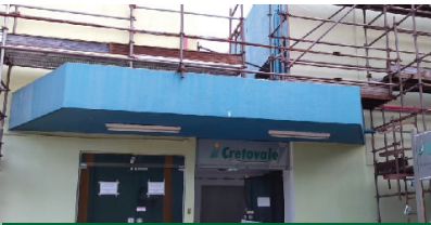
Início da reforma da Agência Tubarão