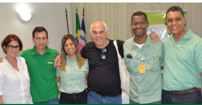
Conselho Fiscal eleito na AGO