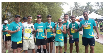
Cooperados na Corrida Vale