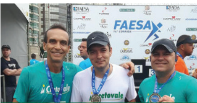
Cooperados na corrida Faesa