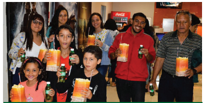
Dia das Crianças no Cinema