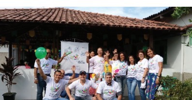
Dia C - Dia de Cooperar