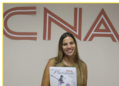
CURSO DE INGLÊS

Cooperados que participam de corridas de rua recebem o reembolso de parte da taxa de inscrição. Ainda ganham uma camisa da Cretovale para participar das corridas.