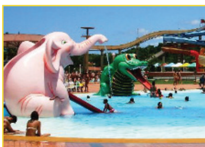
LAZER NO SESC

Os cooperados e seus dependentes podem aproveitar as áreas de turismo e lazer do SESC, nas cidades de Aracruz, Guarapari e Domingos Martins. Para os cooperados, a anuidade é sete reais. É necessário apresentar a carteirinha da Cretovale para se associar ao SESC.