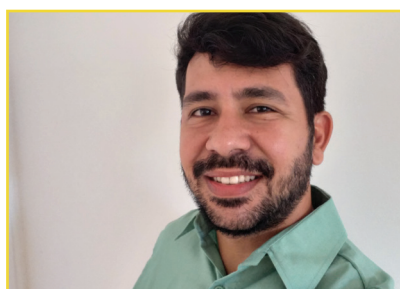
O RUAN FEZ MAPFRE

Os cooperados e seus dependentes podem aproveitar as áreas de turismo e lazer do SESC, nas cidades de Aracruz, Guarapari e Domingos Martins. Para os cooperados, a anuidade é sete reais. É necessário apresentar a carteirinha da Cretovale para se associar ao SESC.