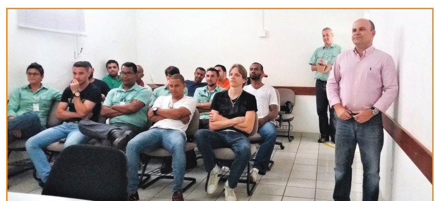
Empregados da estação de Piraqueçu atentos ao vídeo "Consumo por impulso"

Já os cooperados em dificuldades financeiras e dívidas no mercado, podem contar, também, com a orientação do gerente. Para isso basta ir a agência da Cretovale, levando todas as informações sobre as dívidas. "Vamos orientá-lo e tentar financiar suas dívidas com juros menores e melhores condições", afirmou o gerente.